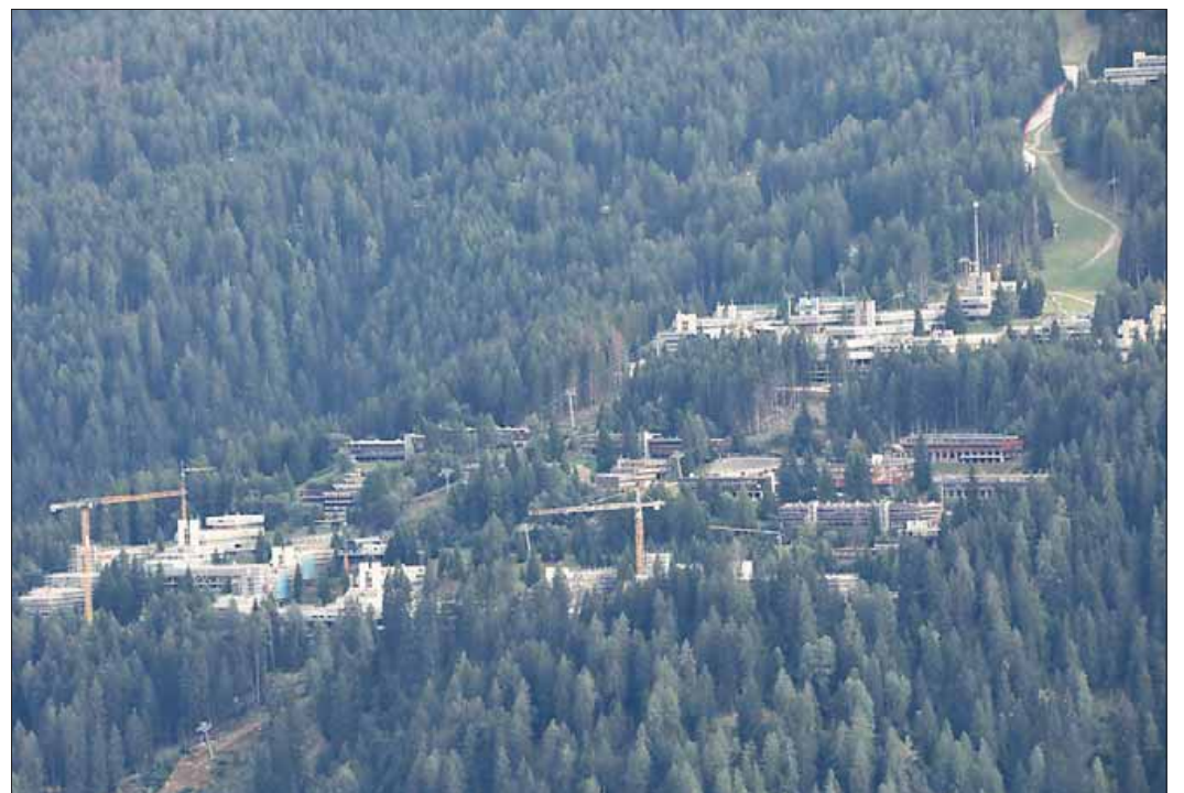
I lavori di riqualificazione energetica a Marilleva 1400 realizzati con il Superbonus

«Sì, non sono stati fatti tutti gli interventi di riqualificazione che ci aspettavamo, ma è così. A Marilleva 1400 c'è il condominio-residence Albarè che da solo vale 3 mila posti letto. Sono 450 appartamenti. È l'edificio più grande del Trentino, più grande dell'ospedale Santa Chiara... Equivale a due paesi della val di Sole. Per i proprietari è stata una opportunità più unica che rara. Un investimen-