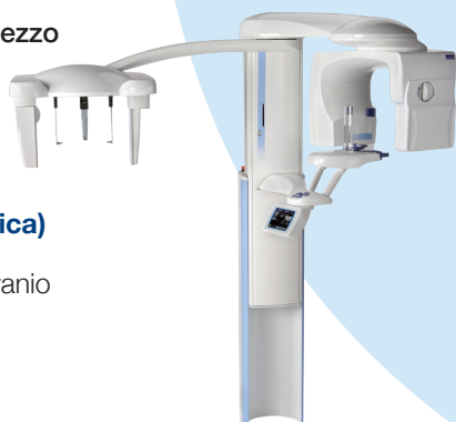
Tomografo a fascio conico