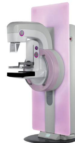
Mammografo con tomosintesi