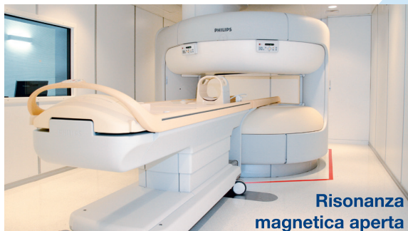
Risonanza magnetica aperta

Nella nuova sede Tecnomed Trento di Via Falcone - Borsellino 3 sono state installate apparecchiature di ultima generazione ad integrazione e completamento dell'offerta fino ad ora a disposizione dei nostri utenti.