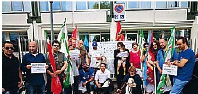
Picchetto La protesta per l'appalto nell'area di servizio Paganella ovest

«La disponibilità manifestata dal presidente di A22 è un primo passo avanti, ma non ci possiamo accontentare degli impegni verbali. Per questi lavoratori serve una certezza di riassunzione», incalzano