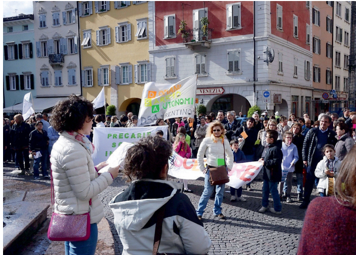
La protesta del 2015 dei genitori e degli insegnanti contro il piano Trentino trilingue